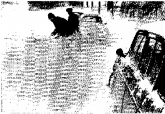
Schneeverwehungen in Norddeutschland

Kabeljau-Schwärme wanderten südwärts; dreimal in den vergangenen vier Jahren rückte, nach fast einem halben Jahrhundert, wieder Packeis vom Polarkreis bis zu Islands Küsten vor. Die Kältewelle dieses Winters scheint eine Hypothese amerikanischer Meteorologen zu bestätigen: Durch kosmische Einflüsse, vor allem Sonnen-