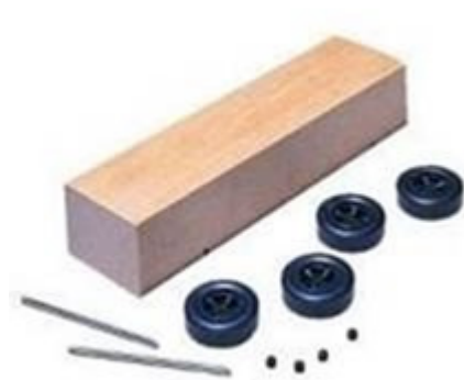
Abbildung 1: Grundbestandteile einer Seifenkiste

Dies ist genau so, als ob man sagt, dass eine Seifenkiste eine gute Approximation eines Rolls Royce oder eines Ferrari ist. Als Beweis führen sie an, dass die Seifenkiste anscheinend einige Spuren-Charakteristika hat und der Straße in der gleichen Richtung folgt – falls sie sich auf einem Hügel befindet.