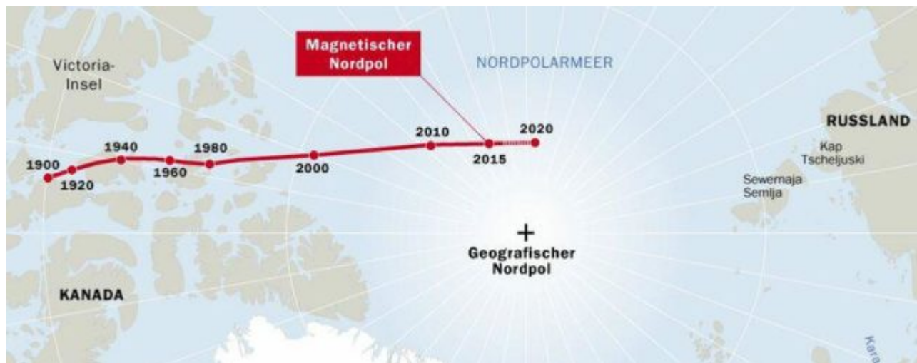
Bild 5: Wanderung des magnetischen Nordpols seit 1900

Die Magnetpole der Erde sind nicht besonders standorttreu; vor allem der Nordpol wandert – und zwar mit derzeit wachsender Geschwindigkeit. Betrug die Wanderungsgeschwindigkeit zu Beginn des letzten Jahrhunderts noch rund 15 Kilometer pro Jahr, driftet der Pol heute mit mehr als 50 Kilometern jährlich in Richtung Nord-Nord-West auf Sibirien zu /6/. Bild 8 zeigt die letzten 120 Jahre seiner Route. Außerdem ist die Stärke des Magnetfeldes in den letzten 150 Jahren um etwa 10 Prozent gesunken.