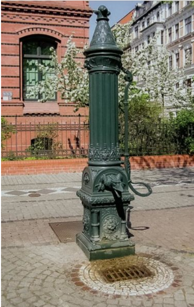
Bild 11: Brunnen mit Schwengelpumpe, wie er u. a. in Magdeburg und Berlin als Notbrunnen deklariert ist. Mit einer Förderleistung von ca. 1.200 Liter pro Stunde könnte er innerhalb von 12 Stunden den Minimalbedarf von 900 Menschen decken. Sein Versorgungsgebiet dürfte wohl die zehnfache Einwohnerzahl enthalten.

Empfehlung: Ziehen Sie die Nutzung eines Trinkwasser-Notbrunnens gar nicht erst in Betracht.