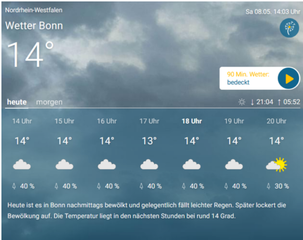
Abb.16, Tatsächliches Wettergeschehen in Bonn. Quelle wie Abb.15

Und auch der Süden meldete nicht die magischen 22°. Der Autor hat exemplarisch die Abb. gewählt, die am 08.05.2021 im Süden Deutschlands die höchsten Temperaturen ausweist.