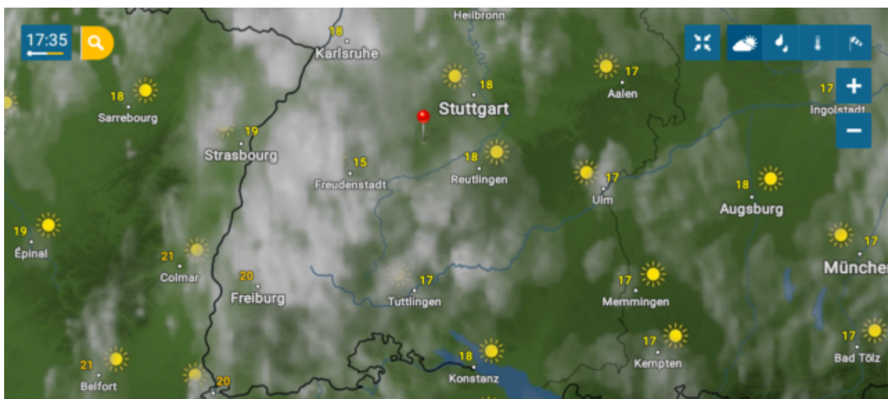
Abb.17 zeigt für den Süden Deutschlands ein Temperaturniveau nicht von „anheimelnden“ 22°C, sondern von „bescheidenen“ 17/18°C. Quelle, wie Abb.15. Nur Freiburg gab 20°C an. Der Autor möchte Ihnen dazu eine Graphik von Herrn Josef Kowatsch zeigen.

Und auch der Süden meldete nicht die magischen 22°. Der Autor hat exemplarisch die Abb. gewählt, die am 08.05.2021 im Süden Deutschlands die höchsten Temperaturen ausweist.