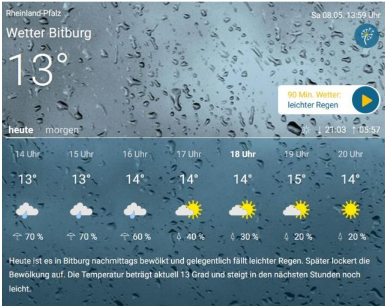
Abb.15, (Quelle). Bitburg meldete Regen und 13°C. Bitburg liegt bekanntlich nicht im Norden Deutschlands, sondern in der Mitte. Ähnliches galt für Bonn (Abb.16).