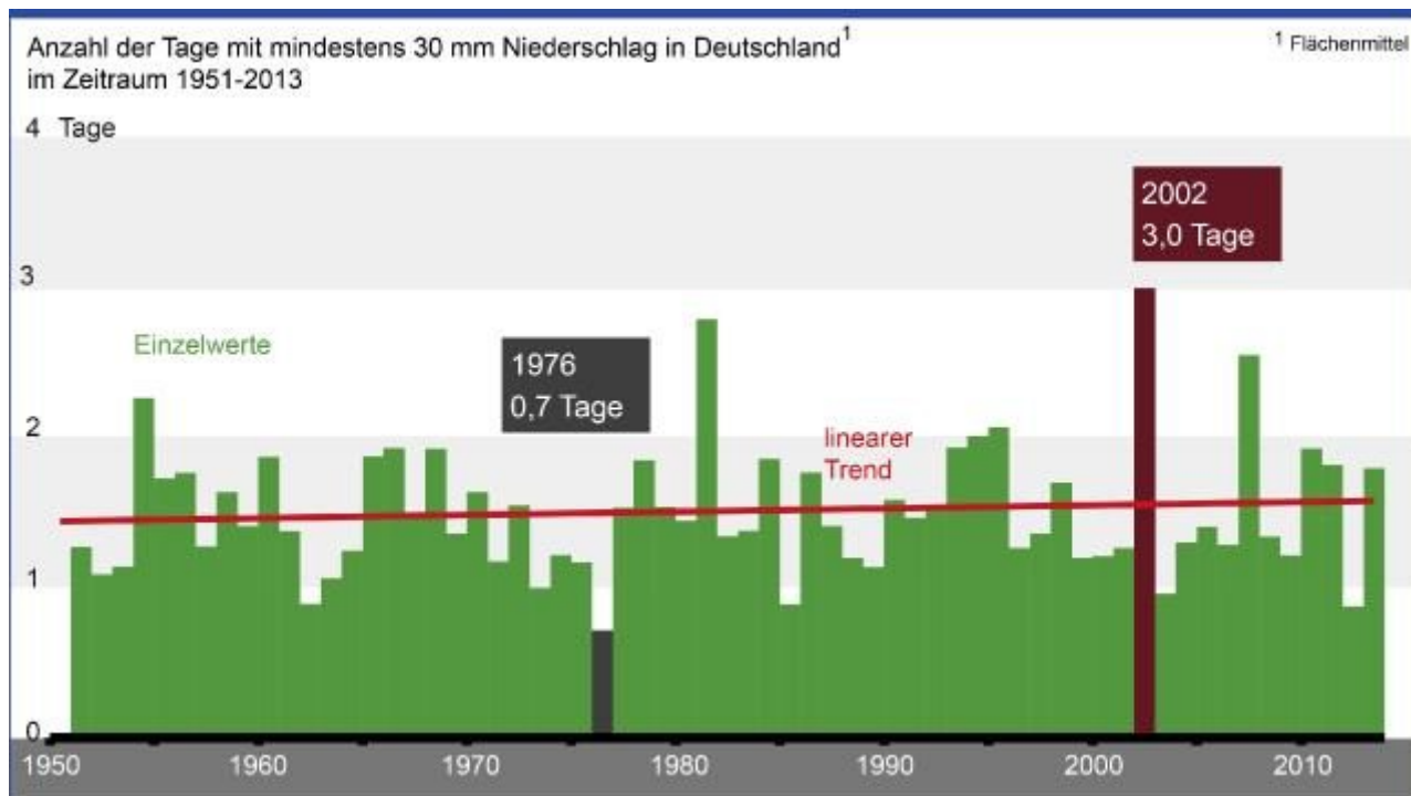
Abb. 3 : Bildunterschrift bei SPON [4] :

„Die Daten des DWD aber zeigen : Es gibt in Deutschland keinen Trend zu mehr Tagen mit Starkregen von mehr als 30 Liter pro Quadratmeter“ ... und auf SPON steht dann als augenscheinlicher Beweis diese DWD-Graphik :