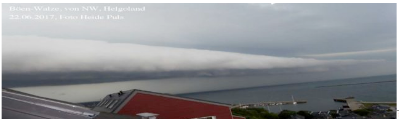
Abb.1: Böenwalze von NW am 22. Juni 2017 über Helgoland (ca. 09.30 Uhr)

Am 22. Juni 2017 zog von NW her eine Unwetterfront über die Deutsche Bucht ( Abb.1 ), und dann über Norddeutschland nach Südosten weiter. Dabei entstand ein Wetter-Phänomen, das nicht so selten ist: In höheren Luftschichten voraus eilende Kaltluft „fällt“ auf der Vorderseite der Front mit Sturmböen zum Boden herunter – es bildet sich eine Böenwalze.