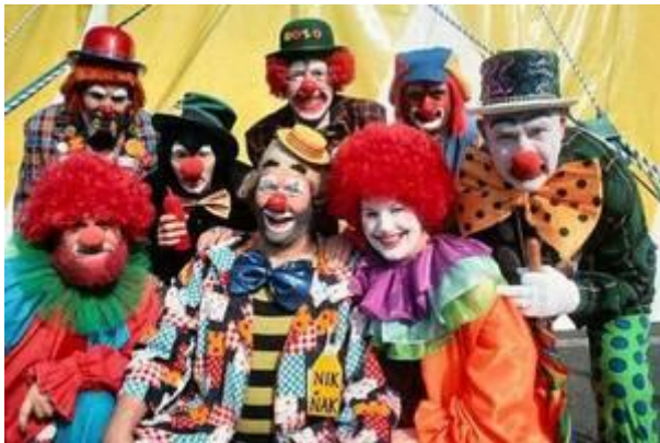
Schaut her, schaut her! Auf den bizarrsten Zirkus der Erde...

Rechtzeitig zu den närrischen Tagen fanden wir diesen Beitrag, Original Präsentiert auf der internationalen Wind Energie Konferenz in Schweden.