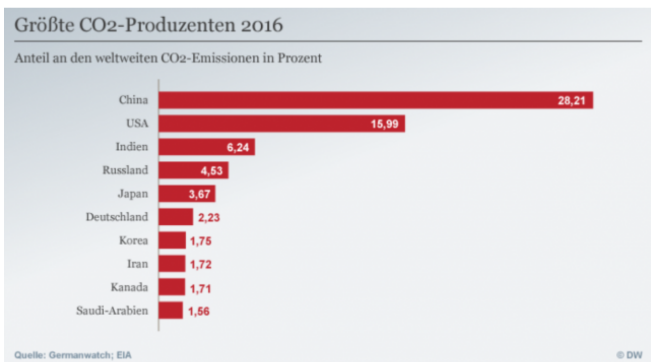
Bild 1 Verteilung der weltweiten CO 2 -Emissionen

Zuerst der Gesamtanteil Deutschlands am anthropogenen CO 2 -Ausstoß (Bild 1). Durch die Verringerung seiner anteiligen 2,23 % um x % behauptet Deutschland, ernstlich die Welt vor einem anthropogenen Klimawandel zu retten. Schließlich hat man den Welt-Klimavertrag aktiv vorangetrieben (in dem keine CO 2 -Daten enthalten sind, nicht einmal ein Hinweis, ab welchem Jahr man die Temperaturdifferenz berechnet, dafür jedoch vor allem Zahlungsverpflichtungen der reichen Länder [4]), als eine der ersten Länder unterschrieben und muss deshalb Vorbild sein, was allerdings wegen sich zunehmend verschlimmerndem, politischen Dilettantismus (Energiewende) nicht gelingt: Tagesschau 28.03.2018: Bis zum 28. März wurden demnach bereits 217 Millionen Tonnen umweltschädliches Kohlendioxid ausgestoßen. Das ist so viel, wie für das ganze Jahr zulässig ist, wenn die Bundesrepublik die vereinbarten Klimaziele einhalten will.