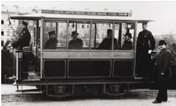
Erste elektrische Strassenbahn von Siemens & Halske 1879 in Berlin

Wenn unsere Bundeskanzlerin Angela Merkel - immerhin promoviert in statistischer Quantenchemie - eine technische Idee lanciert, dann ist höchste Skepsis geboten. Man erinnere sich nur an die sogenannte Energiewende, welche vor fünf Jahren im Nachgang zu Fukushima auf ihre Initiative hin beschlossen wurde. Windräder und Solarkollektoren sollten die schrecklichen Atom- und Kohlekraftwerke ersetzen. Inzwischen weiß man, dass diese Art der Energieerzeugung immens teuer ist, das Stromnetz instabil macht und dringend benötigte Großspeicher nicht in Sicht sind.