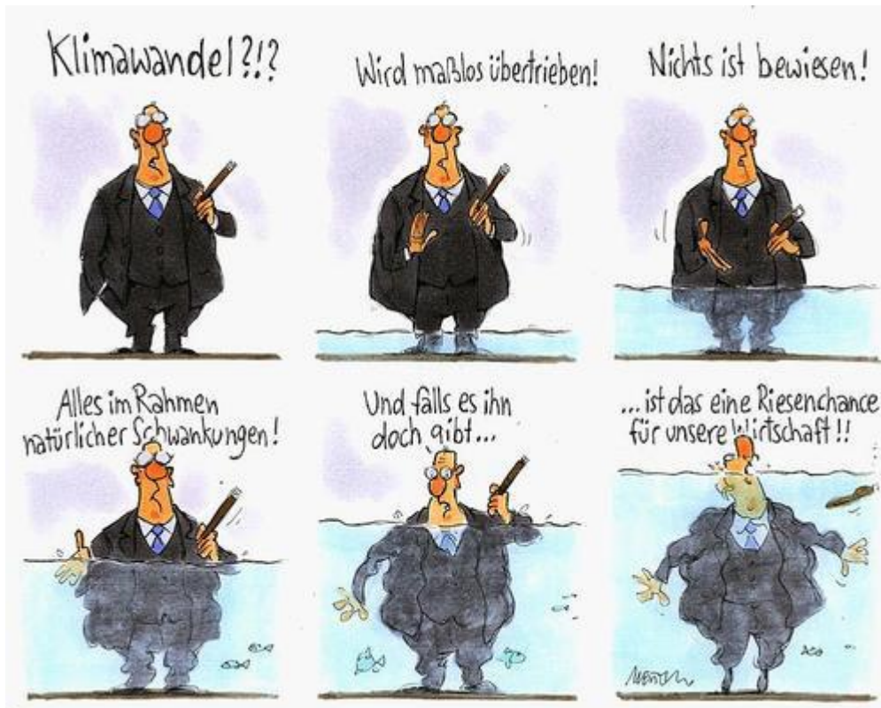
Bild 2 Unterstützendes Bild auf der Homepage „ Karikatur von Gerhard Mester zum Thema Klimawandel “ CC-BY-SA-4.0

Der ansteigende Meeresspiegel und die Zerstörung von Lebensräumen führt schon jetzt dazu, dass Menschen fliehen müssen. Seit 2008 haben bereits über 26 Millionen Menschen wegen Naturkatastrophen ihre Heimat verlassen. Häufig ist das nicht die alleinige Ursache, sondern Verstärker des Elends.