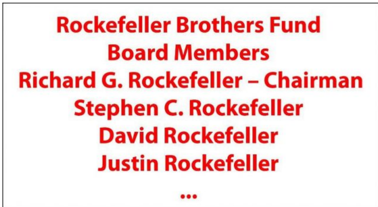
Bild 2. In vielen „wohltätigen“ US-Stiftungen geben die Stifterfamilien weiterhin den Ton an

In den USA bringen Superreiche traditionell ihr Vermögen vor dem Finanzamt in Sicherheit, indem sie Stiftungen gründen. Dazu werden diese als gemeinnützig deklariert und verfolgen angeblich philanthropische Ziele. Umweltschutz und seine heute modernste Variante, der „Klimaschutz“, stehen dabei häufig im Vordergrund . In diesen Stiftungen sind teils enorme Geldmengen gespeichert, man denke nur an Rockefeller Brother, Bill Gates, die Familien Hewlett und Packard sowie zahlreiche weitere. Diese Stiftungen brauchen keine nennenswerten Belegschaften zu finanzieren, müssen keine Investitionen tätigen oder Aktionäre auszahlen – und brauchen sich auch kaum Gedanken über Steuern zu machen. Den Stiftungsverwaltern stehen daher Summen zur nahezu freien Verfügung, die weit über das hinausgehen, was normale Industriebetriebe, kleinere Banken und selbst viele Nationalstaaten aufbringen können.