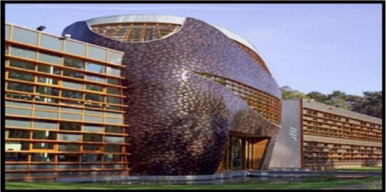
Bild 3. Wenn Sie wieder jemand im Pandakostüm um eine milde Gabe bittet: World Wildlife Fund Headquarters in Zeist