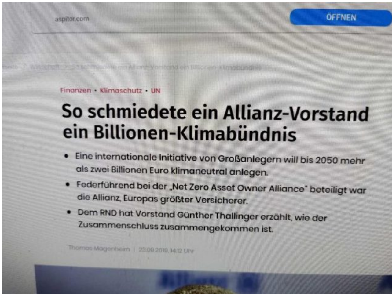
Bild 4. Auch die Europäische Investitionsbank EIB ist inzwischen ganz auf Klimarettung gebürstet