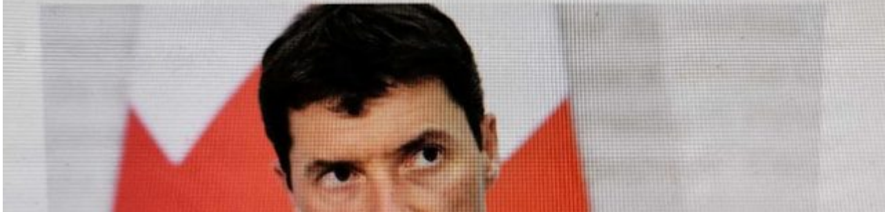
Bild 6. Auch in der Schweiz wurden die Banken auf Linie gebracht, um „Klimasündern“ den Geldhahn zuzudrehen