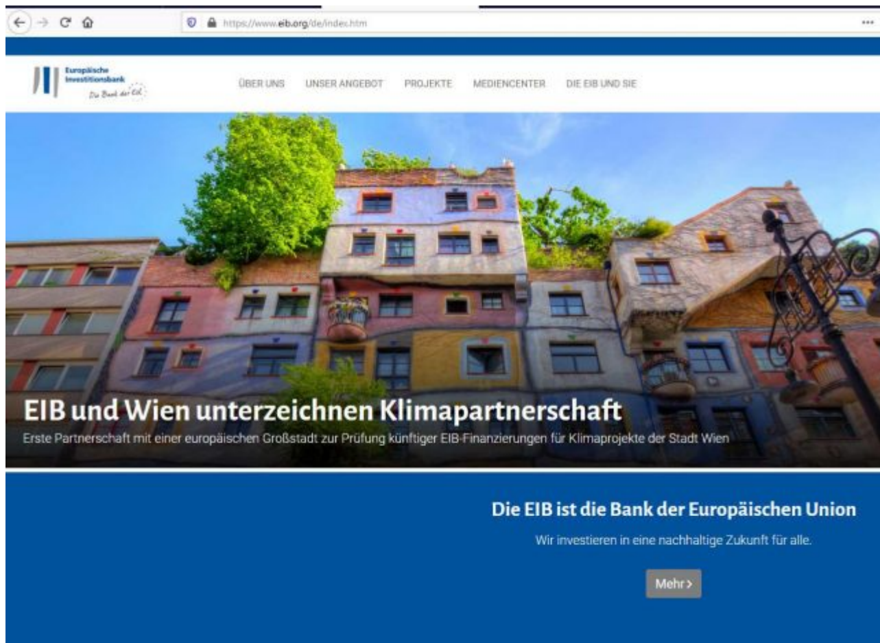
Bild 3. Auch die Europäische Investitionsbank EIB ist inzwischen ganz auf Klimarettung gebürstet

Und auch für die Europäische Investitionsbank EIB steht das Klima nach den Worten ihres Präsidenten Werner Hoyer (FDP) „mittlerweile ganz oben auf der politischen Agenda“. Parole ist auch hier: Jede Finanzierung, die noch nicht grün ist, muss grün werden. Dass Fr. von der Leyen als Chefin der EU-Kommission darüber wachen wird, dass auch das immense Budget der EU nur im Sinne eines Carbon free Europe verwendet wird, braucht nicht betont zu werden. Für Maßnahmen gegen den „Klimawandel“ haben EU und UN allein in der Zeit von 2013 bis 2018 schon atemberaubende 2,5 Billionen US-$ ausgegeben – ohne dass dadurch der CO 2 -Ausstoß bisher zurückgegangen wäre. Er ist im Gegenteil sogar weiter angestiegen. Was nach der jüngst erfolgten Inthronisierung des Tandems von der Leyen/ Lagarde an weiteren Ausgaben auf uns zukommen dürfte, mag man sich lieber gar nicht erst vorstellen.