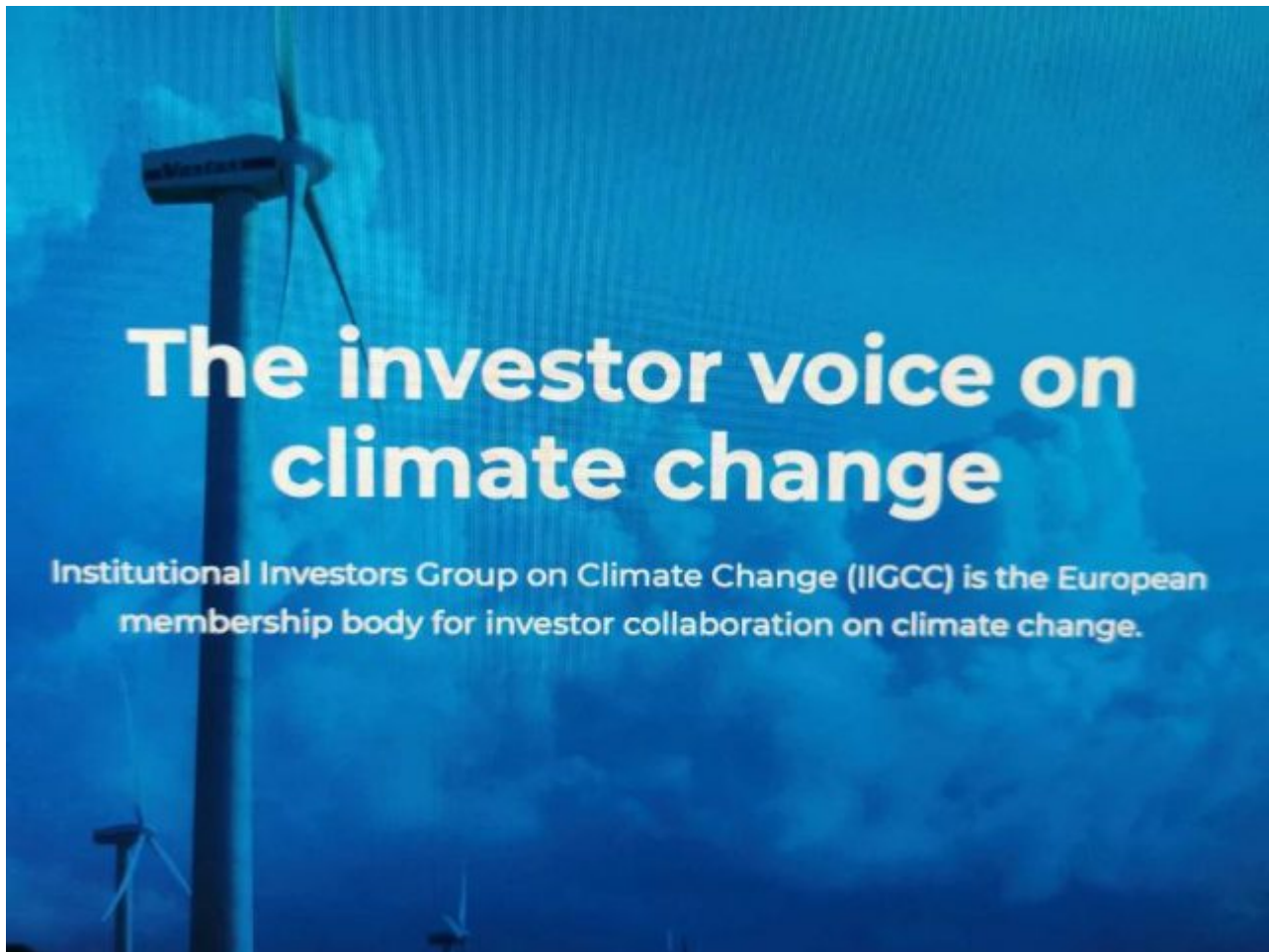
Bild 5. Die IIGCC ist ein Zusammenschluss von europäischen Großanlegern, der Firmen auf Kurs bringt, die sich nicht ausreichend für „Klimaschutz“ engagieren. Freie Marktwirtschaft war gestern

Zur IIGCC gehören auch die Deutsche-Bank-Fondsgesellschaft DWS, die Vermögensverwaltungstochter der Allianz und der deutschen Volksbanken sowie einige der finanzstärksten Pensionsfonds Europas. Zusammen verwalten sie nach eigenen Angaben rund 28 Billionen Euro. Zusätzlich koordinierte die Organisation unlängst einen Appell an die Staats- und Regierungschefs der Welt, in dem 631 Großinvestoren eine schnelle CO 2 -Bepreisung sowie das Aus für alle Kohlekraftwerke verlangten. Eine weitere derartige Organisation ist der in Genf ansässige World Business Council for Sustainable Development (WBCSD), dem weltweit rund 200 Unternehmen mit 19 Mio. Beschäftigten und 8,5 Bio. US-$ Umsatz angehören, die durch ihre Zusammenarbeit „den Übergang zu einer nachhaltigeren Welt beschleunigen“ wollen.