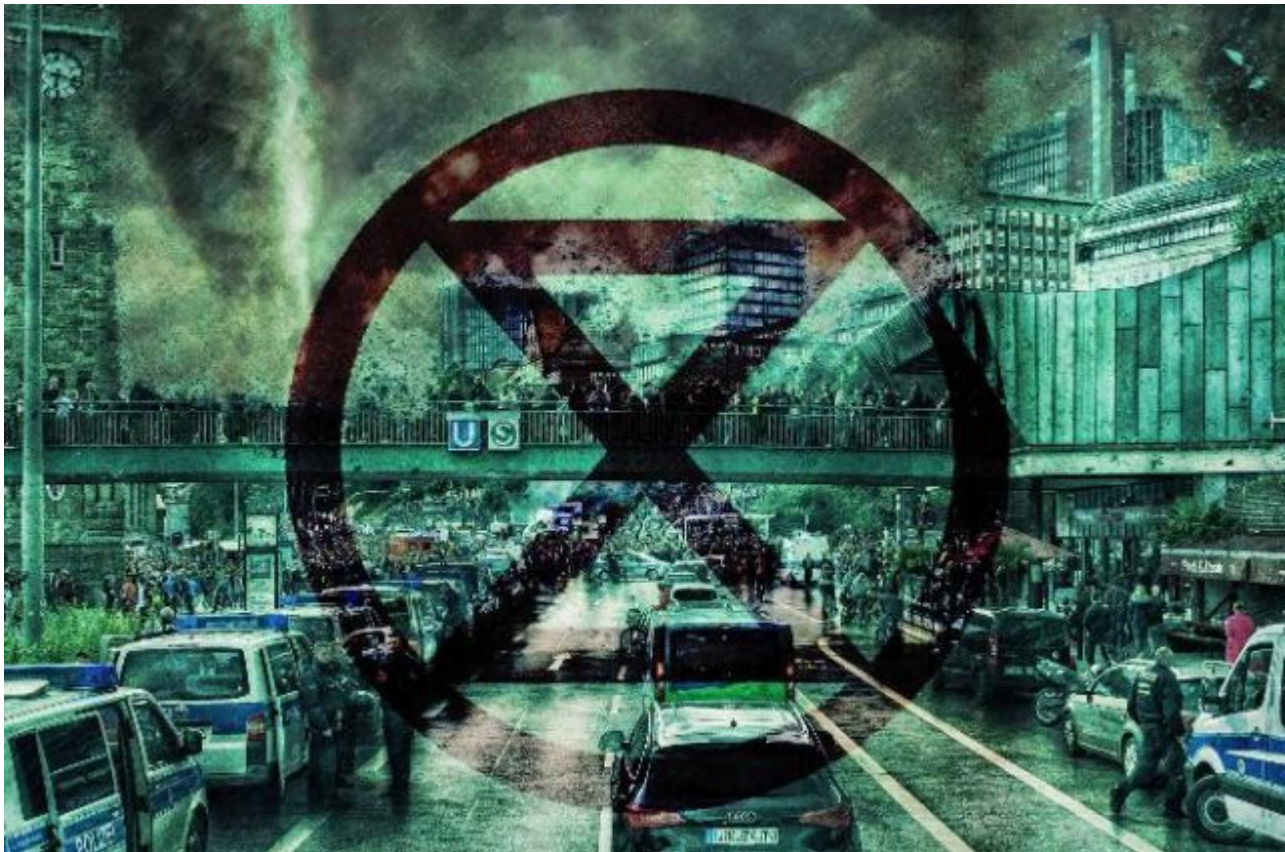
Bild 8. Selbst die eindeutig antidemokratische Weltuntergangssekte Extinction Rebellion wird in der Berichterstattung oft hervorgehoben

aufgewachsen. Der grüne Alarmismus ist ihnen in Fleisch und Blut übergegangen. Das ist viel schlimmer als eine Gleichschaltung, wie man sie aus autoritären Staaten kennt: Diese Generation, die mittlerweile in vielen Redaktionen das Sagen hat, ist sich ihrer eingeschränkten Wahrnehmung gar nicht mehr bewusst. Sie denken vornehmlich in Freund-Feind-Kategorien und teilen die Welt am liebsten in Gut und Böse ein... Während Interviews mit liberalen oder konservativen Politikern inquisitorischen Verhören gleichen, muss das grüne Spitzenpersonal kaum fürchten, dass sein moralischer Rigorismus mit praktischen Einwänden bloßgestellt wird.“