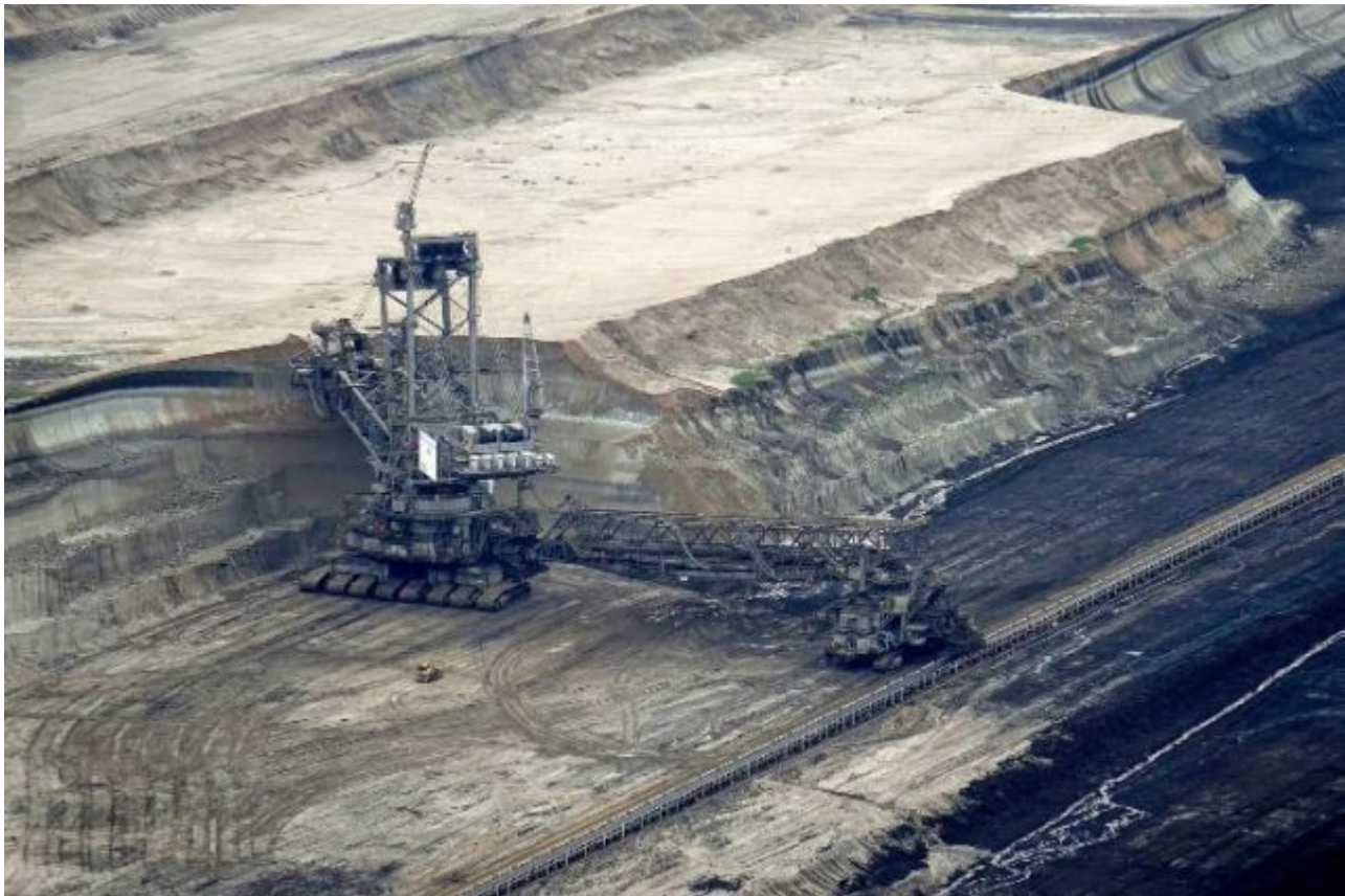
Bild 4. Vom Wahrzeichen der Daseinsvorsorge zum Hasssymbol vieler Journalisten: Ein Braunkohlebagger

der Ansichten durchsetzt. Wer auch nur etwas abweicht, der findet sich, wie es ein SPON-Journalist einmal beschrieb, bald in der Kantine allein am Tisch wieder, weil er von den anderen gemieden wird. Übrigens hat besagter Journalist inzwischen sowohl den Kaintinentisch als auch seinen Schreibtisch bei SPON geräumt (räumen dürfen?).