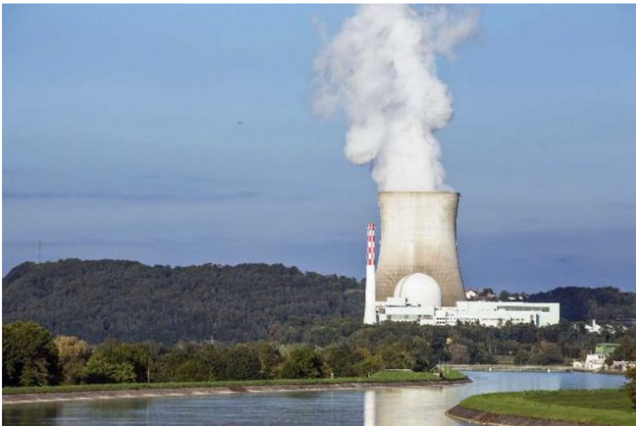
Bild 5. Kernkraftwerke gelten den meisten Journalisten als Höllenmaschinen

ergab, dass 42 % der Politikjournalisten den Grünen zuneigen, 24 % der SPD und nur 14 % der CDU sowie 12 % der FDP. Diese Zahlen dürften allerdings nicht die heutige Realität widerspiegeln, sondern lediglich die nach außen kommunizierte Selbsteinschätzung. Anders ausgedrückt: Das Wertesystem deutscher Journalisten unterscheidet sich grundlegend von dem der Bevölkerung. Sie werten offenkundig Parteien wie FDP und CDU sowie zumindest Teile der SPD (Schröder) als „Rechts“ statt als „Mitte“, verorten Grüne und Jusos als „Mitte“ und vertreten darüber hinaus zu erheblichen Teilen linksradikale und sogar extremistische Positionen. Dies zeigt sich an oft extrem einseitigen Berichterstattungen zahlreicher Medien über die Fridays for Future, die Besetzungen des Hambacher Forstes und von Tagebauen in der Lausitz sowie über die Fast-schon-Terroristen von Extinction Rebellion. Vom Ausland aus betrachtet wird dies viel klarer gesehen als im Inland, wo eine Journalistenkrähe offenkundig der anderen kein Auge aushackt. So stellt ein Bericht in der „Neue Zürcher Zeitung“ mit dem Titel „Das Herz des deutschen Journalisten schlägt links“ fest, dass neutraler Journalismus (in Deutschland) eine Illusion sein dürfte. Ebenso kritisch liest sich der Beitrag „Grün ist die Redaktion – die deutschen Mainstream-Medien haben aus der Flüchtlingskrise nichts gelernt.“