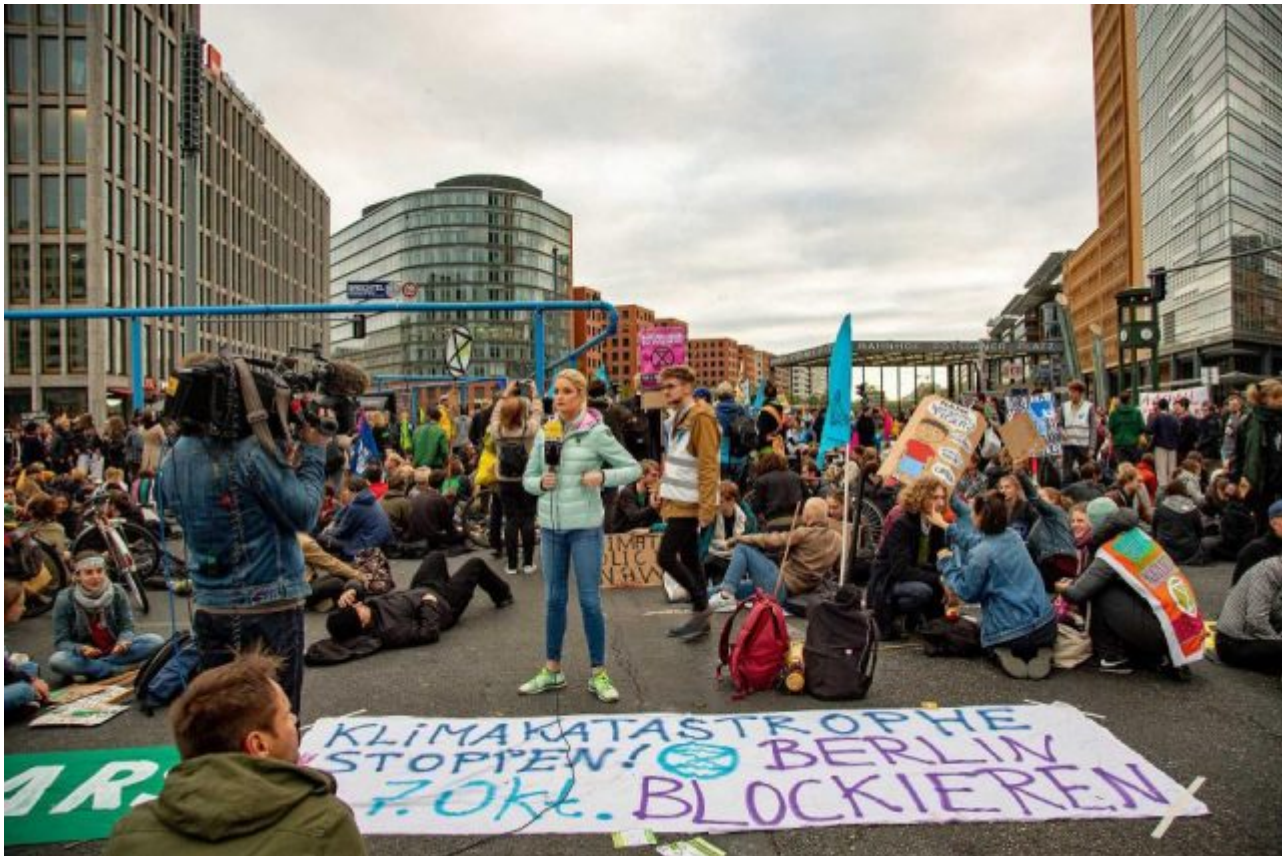
Bild 7. Fridays for Future-Demonstranten sind das Liebling der Medien