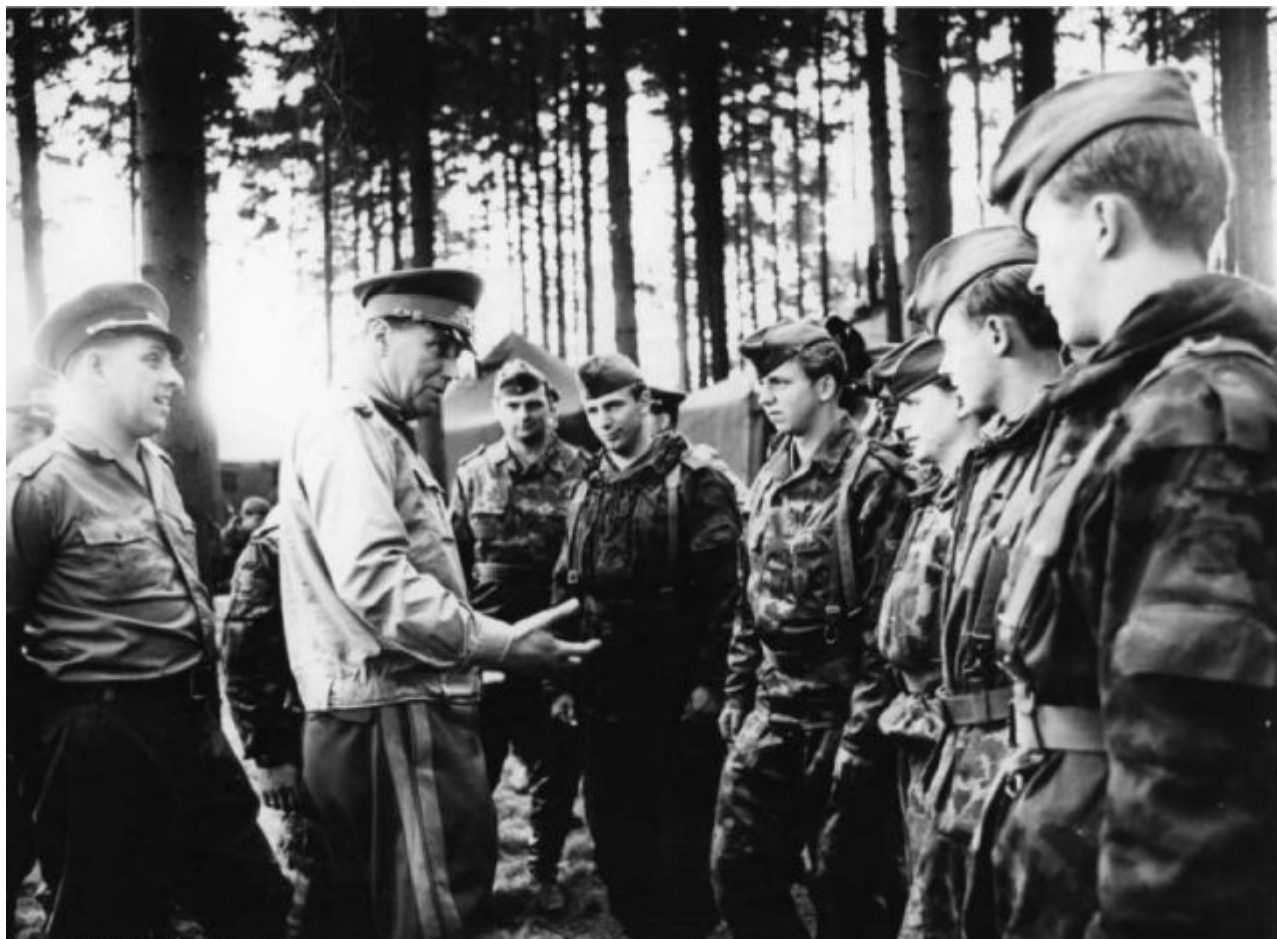
September 1968