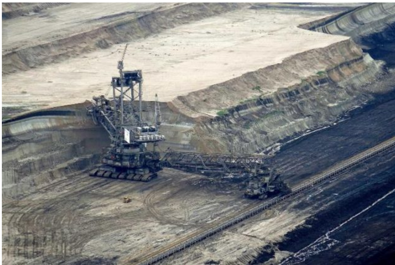
Bild 4. Vom Wahrzeichen der Daseinsvorsorge zum Hasssymbol vieler Journalisten: Ein Braunkohlebagger

der Ansichten durchsetzt. Wer auch nur etwas abweicht, der findet sich, wie es ein SPON-Journalist einmal beschrieb, bald in der Kantine allein am Tisch wieder, weil er von den anderen gemieden wird. Übrigens hat besagter Journalist inzwischen sowohl den Kaintinentisch als auch seinen Schreibtisch bei SPON geräumt (räumen dürfen?).